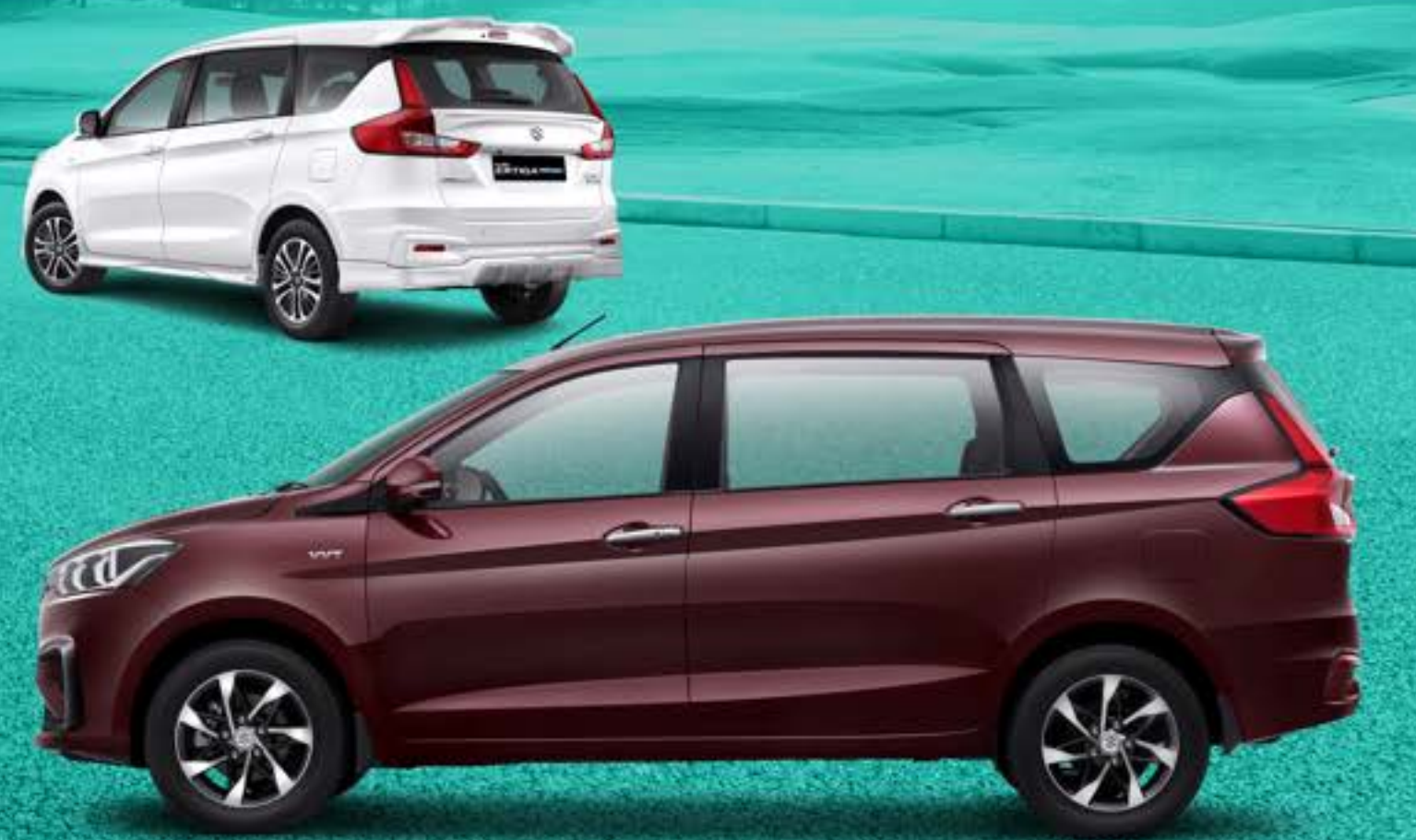
LED REAR COMBINATION LAMPS WITH LIGHT GUIDE (SS, GX)