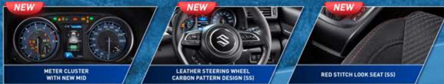
METER CLUSTER WITH NEW MID