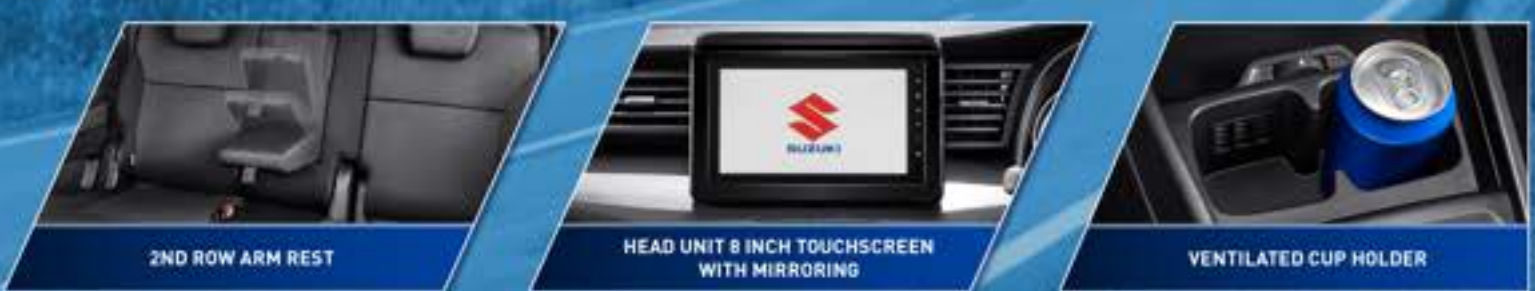
2ND ROW ARM REST