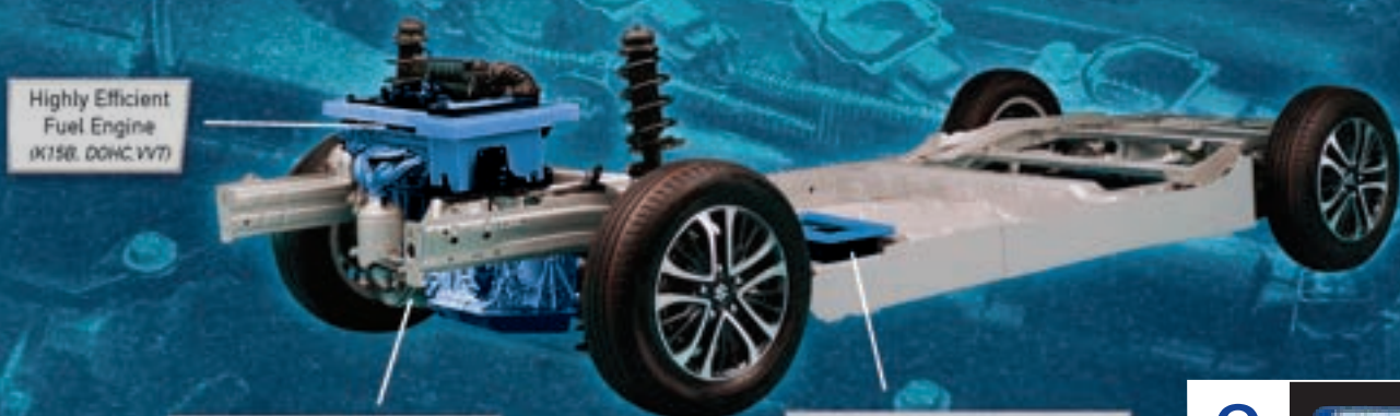
Highly Efficient Fuel Engine (K15B DOHC VVT)

Teknologi futuristik dengan struktur sederhana memberikan performa optimal. Ditambah fitur pintar untuk pengalaman berkendara lebih baik.