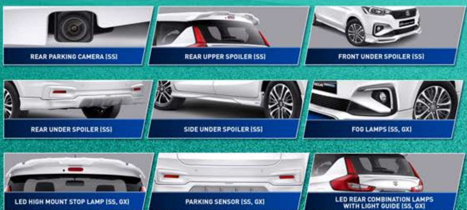
REAR PARKING CAMERA (SS)

All New Ertiga Hybrid hadir dengan tampilan baru yang modern sesuai perkembangan zaman. Sebuah mobil keluarga pintar dengan tampilan premium dan stylish, siap menjadi mobil Kebanggaan Keluarga.